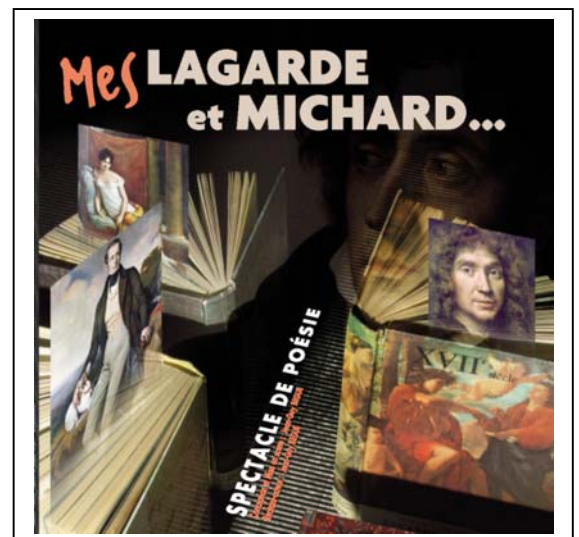
Couverture du programme